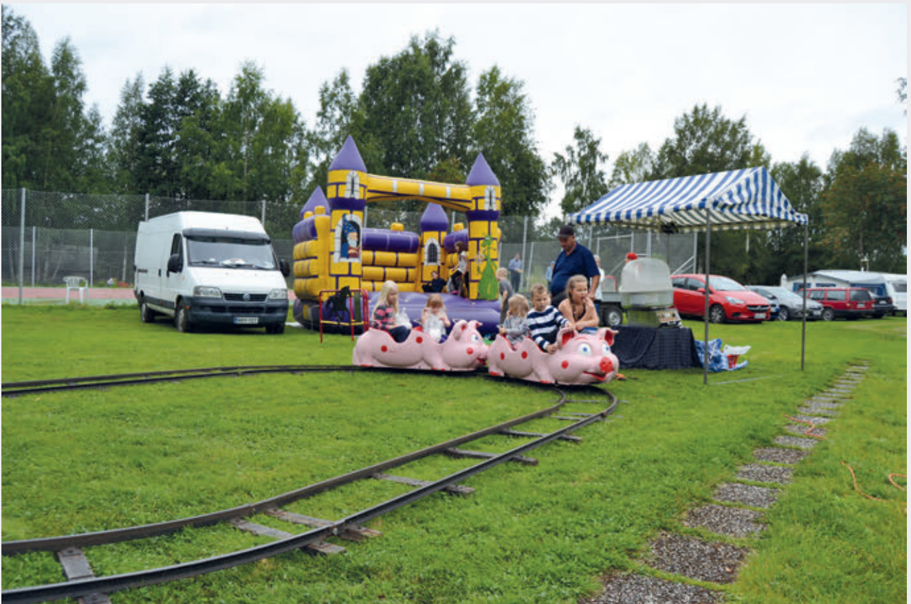
Possujunassa on tunnelmaa.