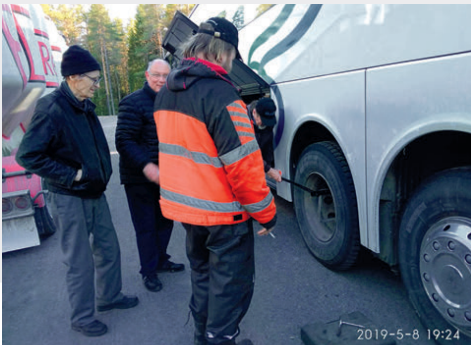
Pojat joutuivat rengastöihin Oulun matkalla.