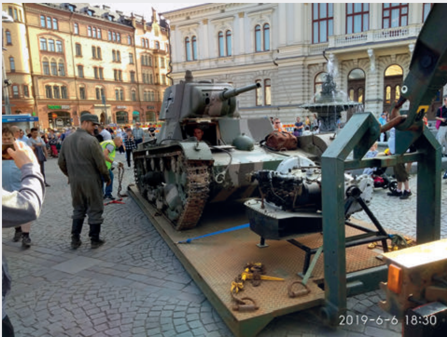
Tampereen keskustassa oli sotakalustoa liikkeellä.