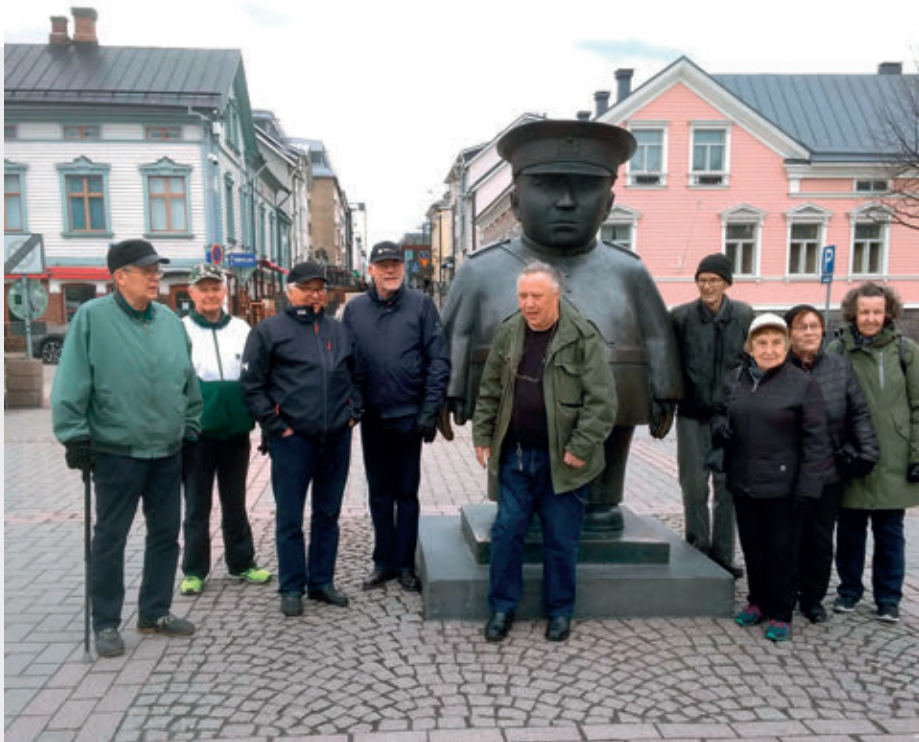
Oulussa patsasteltiin poliisi patsaalla.