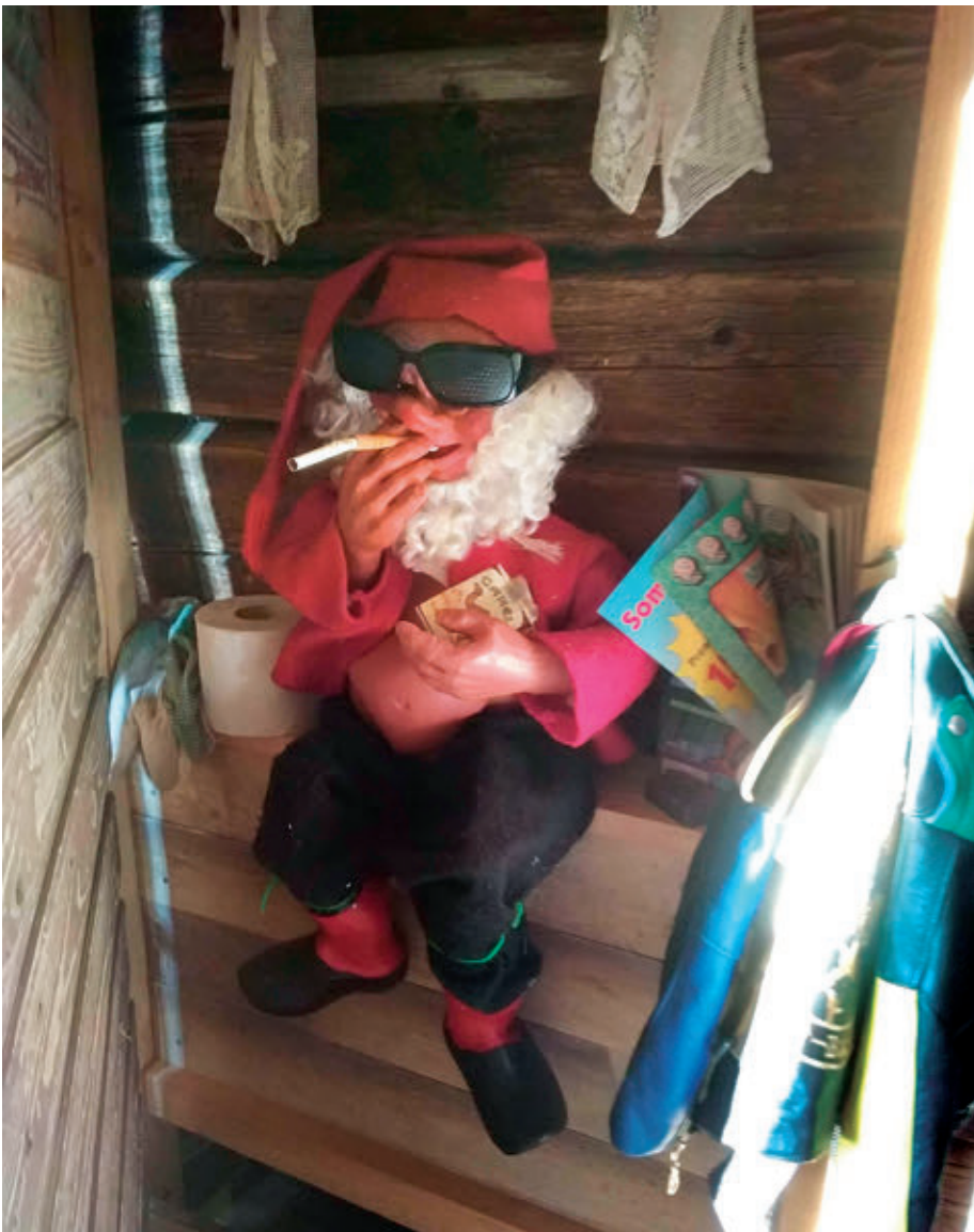
Tonttumuseossa tontutkin käyvät salasavuilla.