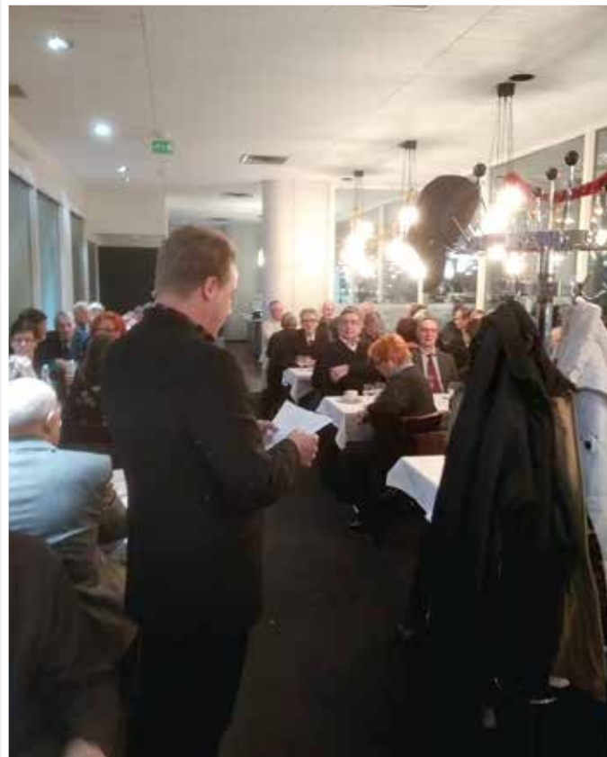
Ammattiosaston johdon tervehdyspuhe 10-v. juhlassa.