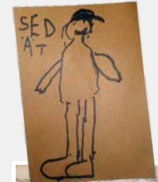
Tuollainen tuli vastaan Lapualla.