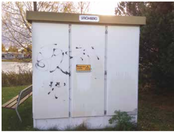
Tuollaisiakin on osa meistä tehnyt.