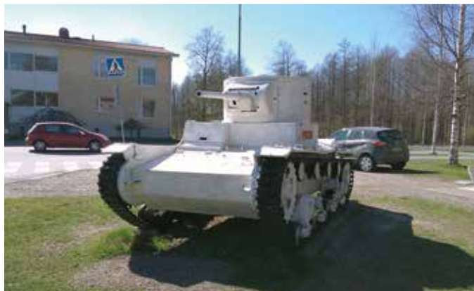
Sotakoneitakin on nähty.