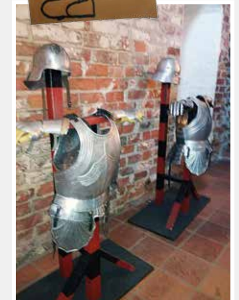
Hämeenlinnassa oli laitettu haarniskat naulaan.