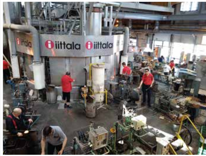
iittalassa lasinpuhaltajat töissä.