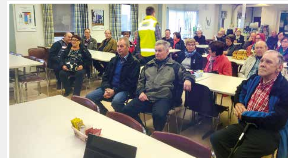
Valmetin tehtaalla Lapualla kuunneltiin tarkasti yritysesityksiä.