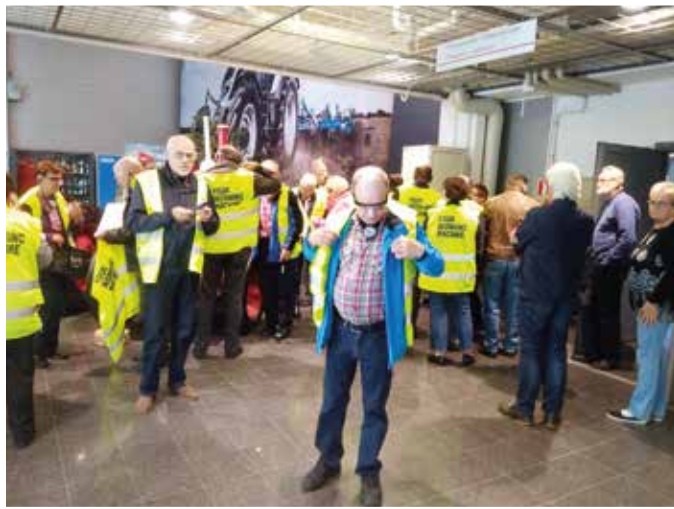
Suolahden Valtran tehtaalla menttiin turvallisuus edellä.