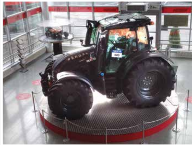
Saimme nähdä kuinka tämäkin Valtra on valmistettu.