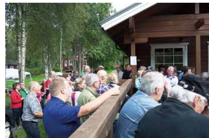
Odottava tunnelma sano jo se oikea numero