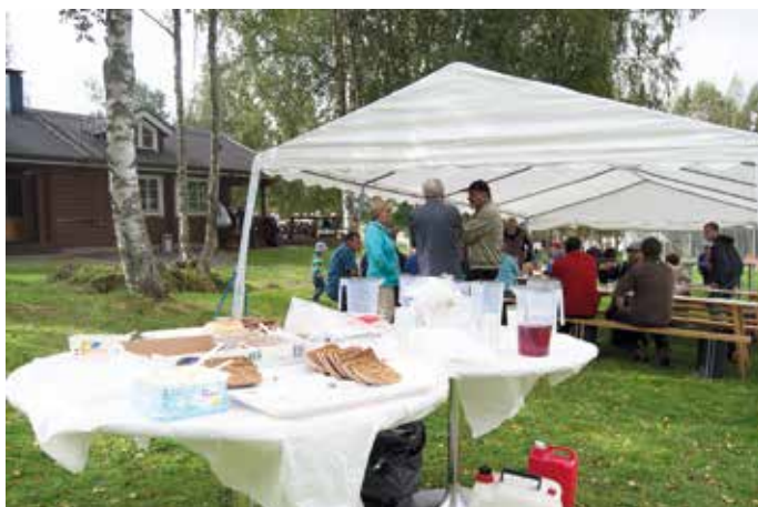
Ruokailua, huomioi ampiaiset