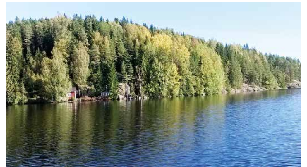
Maisemat jokiristeilyllä oli upeat