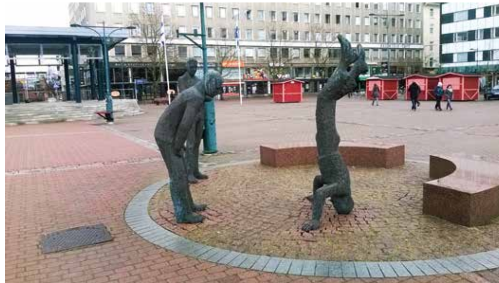
Porissa seisoo patsaatkin päällään