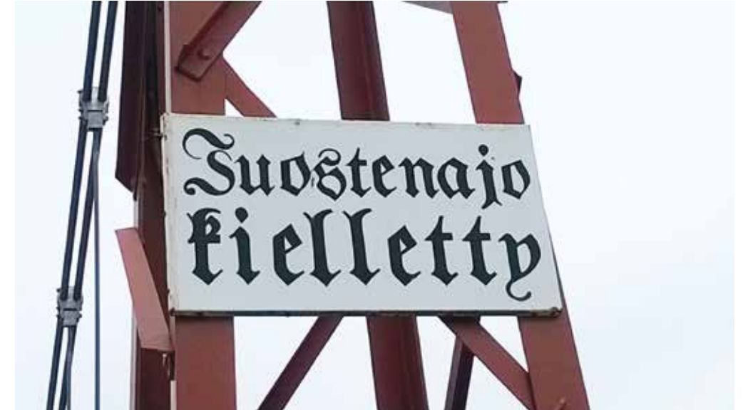
Tällainenkin kyltti tuli vastaan