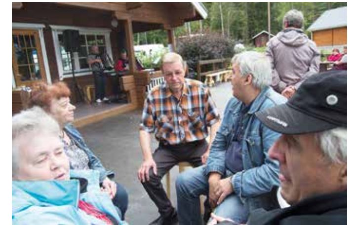
Juttua ja tarinaa riitti