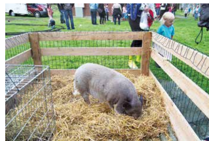
Possu kaivaa, onkohan tryffeileitä?