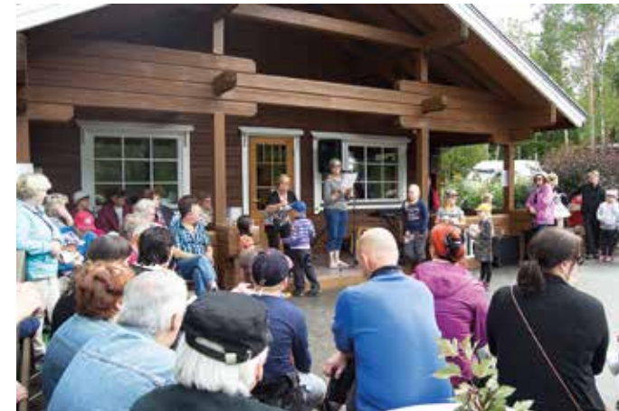
Arvonta alkaa jännitys kohoaa