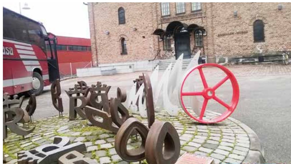
Rosenlewin museon edusta