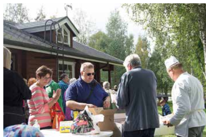
Makkara paikalla kuultua, voisiko ottaa toisenkin?