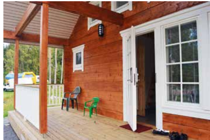
Ovi on auki kaikille ammattiosaston jäsenille, vuokrahan sitä