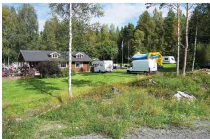
Voi tätä näkymää, ihmisillä hyvä mieli, tanssi raikaa