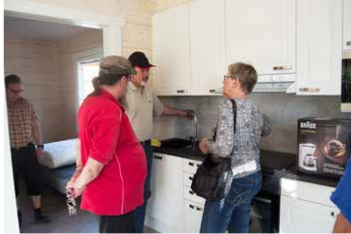
Ammattiosaston toimikunta uuden mökin tiloihin tutustumassa