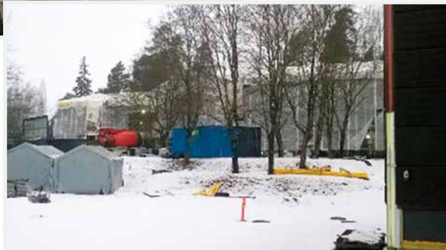
Kuva Murikan sisäpihalta peittojen suojaamasta rakennuksesta