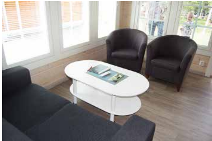
Uuden mökin sisältä