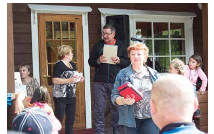
Ja joku aina voittaa