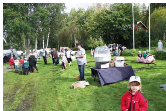
Lapset pääsivät tutustumaan possujunaan ja hattaraan