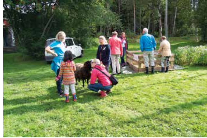
Aava-kertun kotitalan eläimiä ihastellaan.