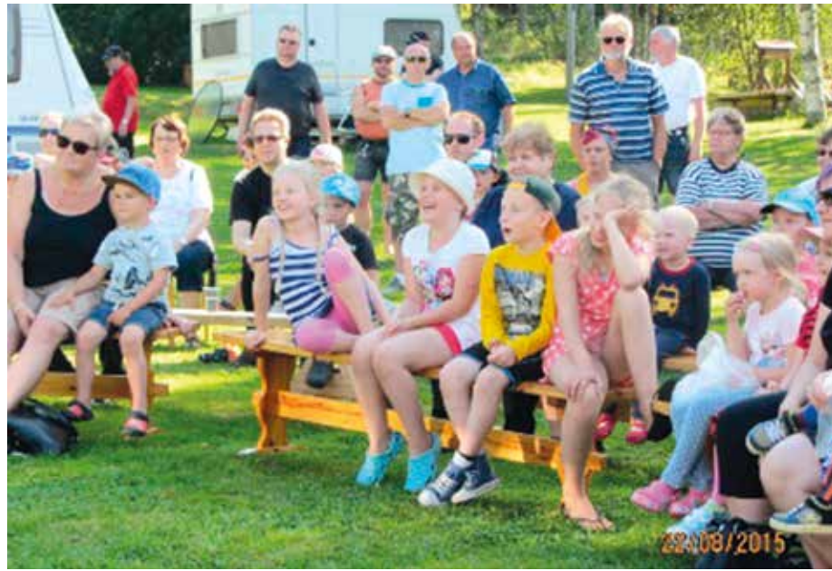
Pikku aasin nukketheateresitystä seuraamassa eloriehassa