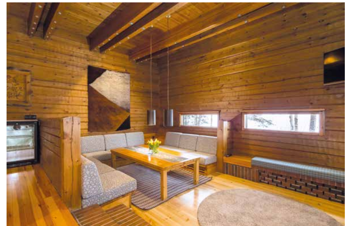
Murikan pidetyin paikka on ihana, maakattonen ja hirsinen rantasauna. Remontin jälkeen ensimmäiset löylyt otettiin tammikuussa.