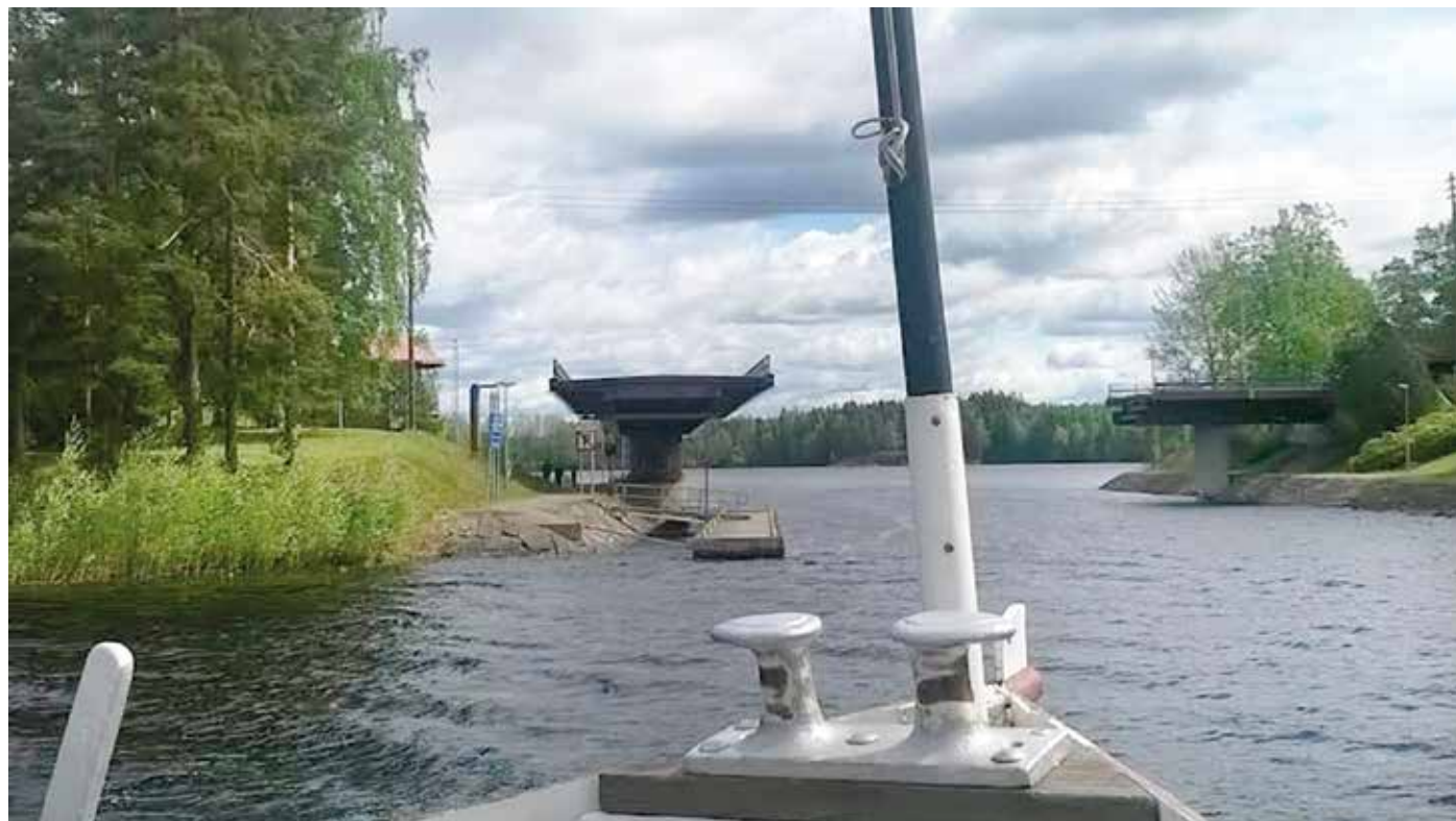
Kääntösilta veteraanien retkellä