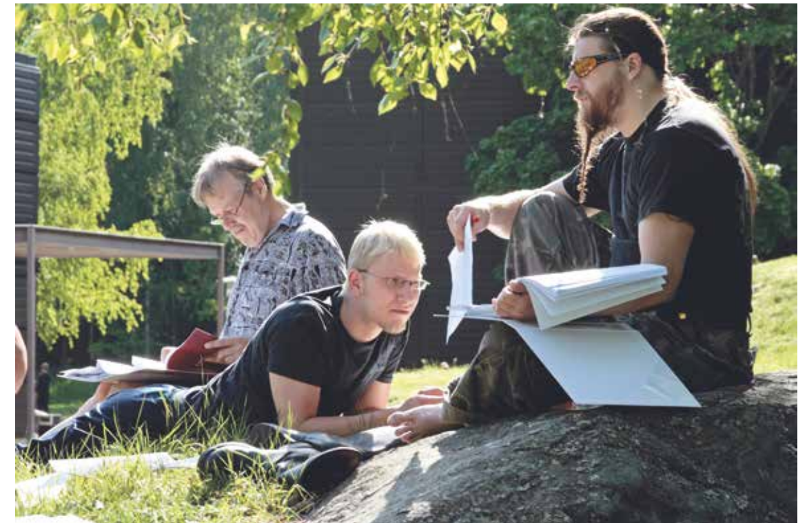
Murikassa ei jäykistellä. Kuvassa työsuojelun opiskelua Murikan sisäpihalla.