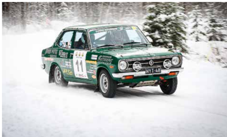
Pohjola ralli 2016

A lle kouluikäisestä asti autokilpailuissa mukana olleella pojalla syntyi ajatus, että jonain päivänä olisi kiva kokeilla myös itse kilpa-autolla ajamista. Aluksi ennenkuin vaadittu ikä tuli täyteen kuljin varikolla sekä myös toimitsija tehtävissä autotelemassa muita.