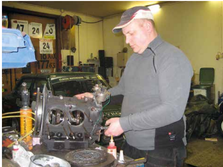
Utta moottoria kesäksi