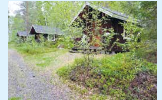
ABB:n vakuutuskassan kuulumisia

V uoden 2016 alusta voimaan tulleet Suomen hallituksen säästötoimenpiteet koskettavat myös vakuutuskassan jäseniä. Sairausvakuutuslain mukaisiin lääkekorvauksiin tuli 50 euron alkuomavastuu . Kela-korvattavista lääkkeistä saa korvusta vasta kun tuo alkuomavastuu on täyttynyt. Apteekki seuraa alkuomavastuun täyttymistä ja lääkkeistä tulee Kela-korvaus ja kassan lisäkorvaus vasta alkuoma-vastuun täyttymisen jälkeen .