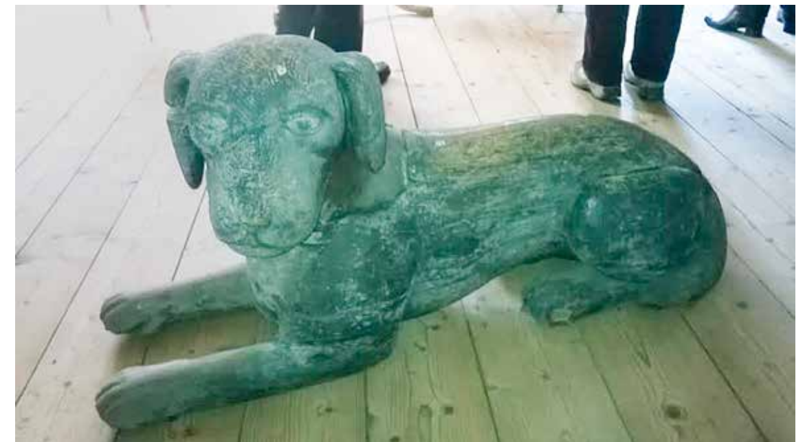
Puukoira veteraanien nähtävänä